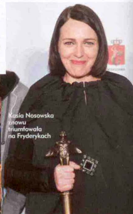
Kasia Nosowska znowu triumfowała na Fryderykach