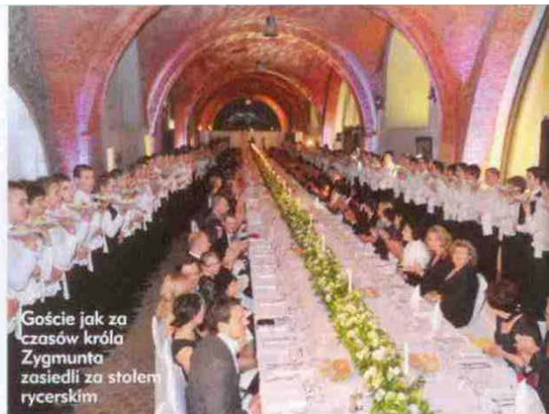
Goście jak za czasów króla Zygmunta zasiedli za stołem rycerskim