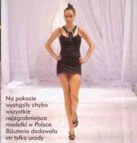
Na pokazie wystąpiły chyba wszystkie najzgrabiejsze modelki w Polsce. Biżuteria dodawała im tylko urody