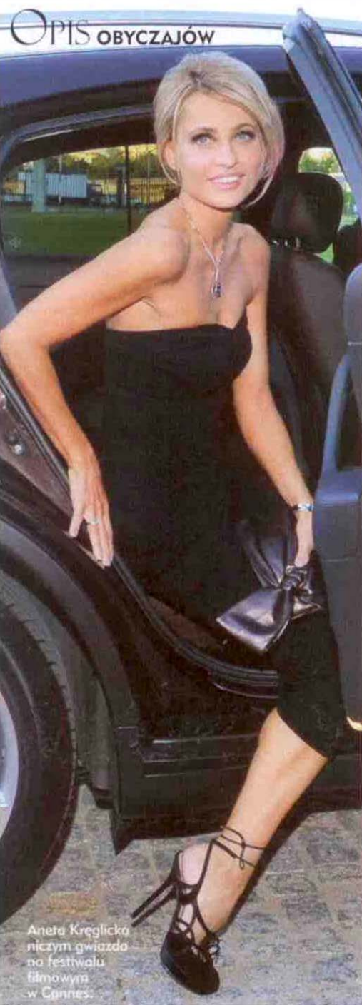
Aneta Kręglicka niczym gwiazda na festiwalu filmowym w Cannes.