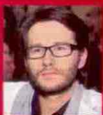
PARTYMIX redaguje WOJCIECH GRZYBAŁA