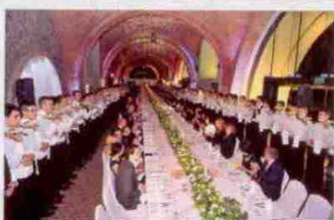
Kolacja w wielkim stylu: stu osiemdziesięciu gości i tyluż kelnerów!